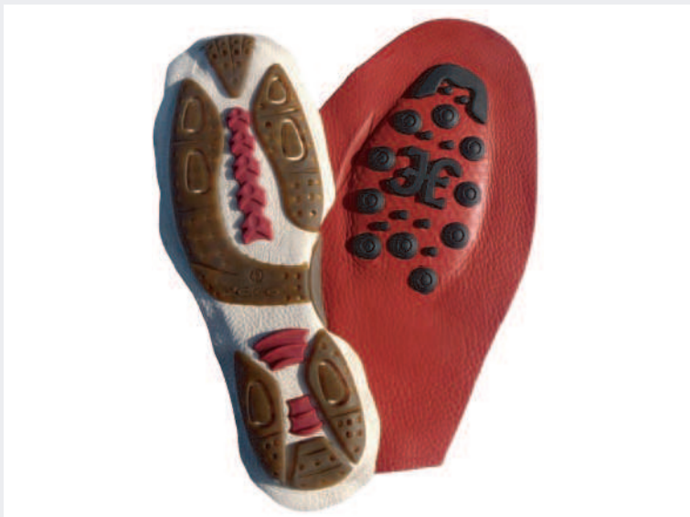
8 | Stampi per fustelle ricavate e tranciatura cuoio per soles antiscivolo in cuoio+poliuretano.

In alternativa allo stampo per tranciatura cuoio siamo in collaborazione con un moderno fustellificio