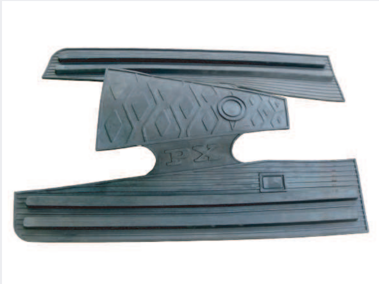
7 | Stampi per tappetini e pallet gomma e polimeri.